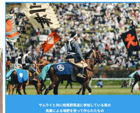
サムライと共に相馬野馬追に参加している馬の馬糞による堆肥を使って作られたもの